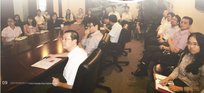
09 中国复材集团 | China Composite Group Corporation Limited